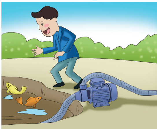
插画 / 宋柳

生态赤字的主要后果就是气候变化——由于化石燃料的过度使用，人类排放的二氧化碳已经超出了地球生态系统的